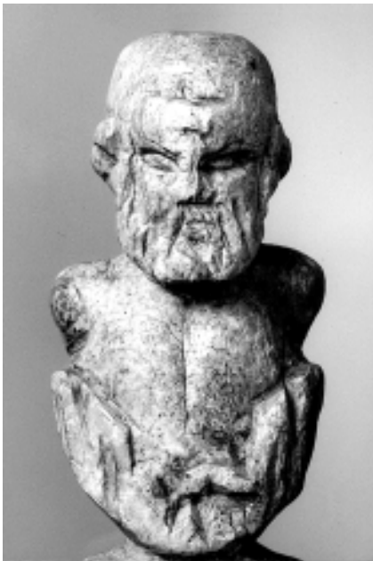
Klappmessergriff mit Philosophenbüste, Knochen oder Geweih, wahrscheinlich mittelkaiserzeitlich.

Die «Worked Bone Research Group» trifft sich nach London und Budapest nun zu ihrer 3. internationalen Tagung in Basel. Organisiert wird sie von der Archäobiologischen Abteilung; Spezialisten werden über die Verwendung von Knochen, Geweih und Elfenbein als Rohstoff für die Werkzeug- und Schmuckherstellung von der Urgeschichte bis zur Neuzeit referieren. Eine wichtige Materialgruppe, bisweilen als «Plastik der Ur- und Frühgeschichte» bezeichnet, steht damit im Zentrum des Interesses. Denn seit der Älteren Steinzeit bis in die frühe Neuzeit war Bein ein beliebtes Rohmaterial für eine ganze Reihe unterschiedlichster Produkte – «Menschheitsgeschichte von der Speerspitze bis zur Zahnbürste».