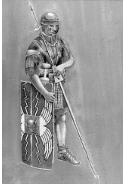
Römischer Legionär des 1. Jhds. n. Chr., Aquarell S. Bieri, Römerstadt Augusta Raurica.

ROMECS XIII (Roman Military Equipment Conference), die internationale Konferenz zur Erforschung römischen Militärs bzw. dessen Ausrüstung tagt im Herbst 2001 in Windisch/Vindonissa. Gastgeberin ist die Kantonsarchäologie Aargau. An der Organi-